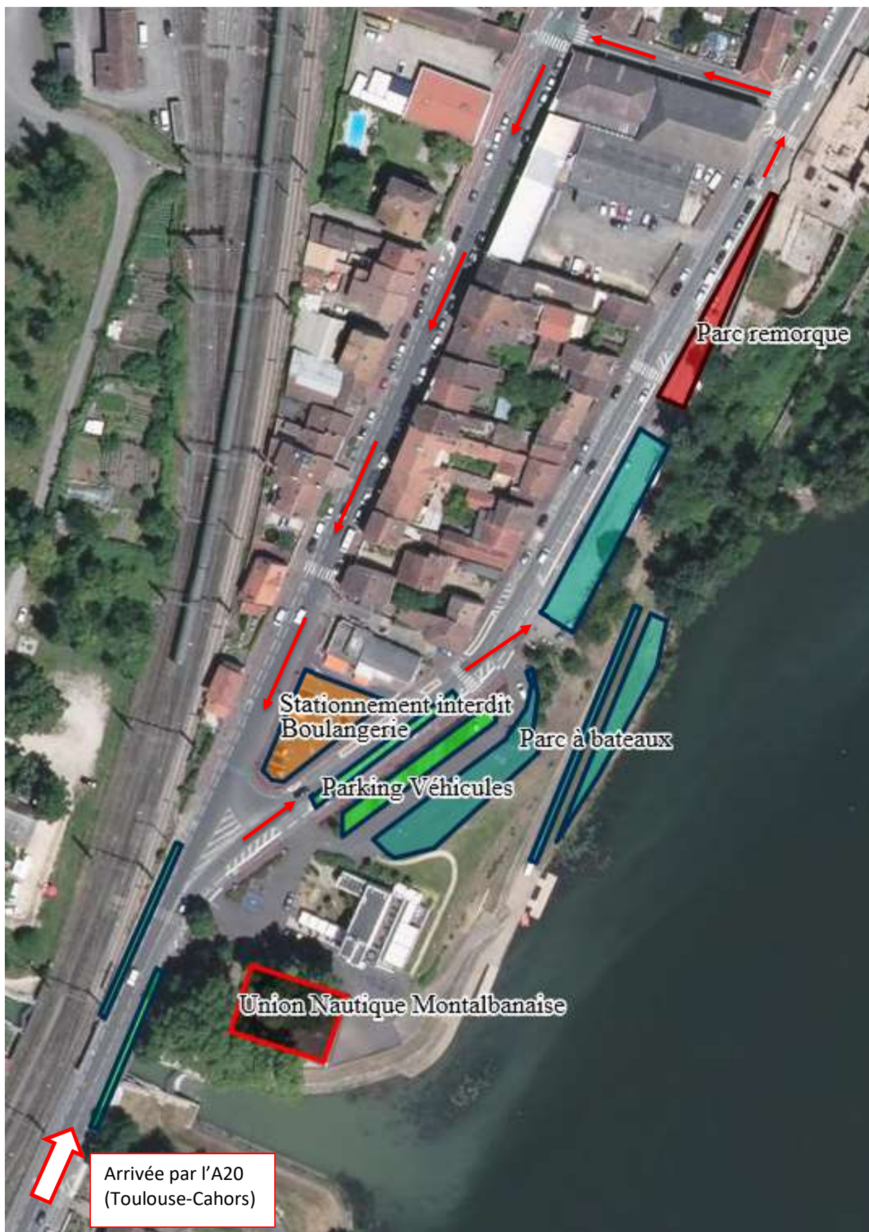
PLAN PARC A BATEAUX ET STATIONNEMENT